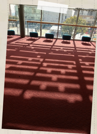
くらら大ホール・ホワイエに注ぎ込む、木漏れ日。酒蔵のなまこ壁をイメージしている。

舞台袖からステージを見る風景は格別だ。袖から、ステージに立つアーティストの背中を見るのが私は大好きである。コンサートや文化事業の仕事に携わってかれこれ十数年、この風景が見られるのはホールの仕事に就く者の特権といえよう。アーティストの背中には雄弁だ。彼らの色んな思いが伝わってくるかのようで、実にまぶしい。そして演奏が終わり、袖からほんの少しだけのぞける客席のお客様の嬉しそうな顔と、割れんばかりの拍手。その空間をただよう一期一会の感動の連鎖を、袖から少しだけ共有させていただいている。そんな思いで、今日も私は舞台袖に立っている。(事業担当 K S)