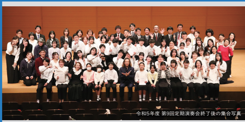
令和5年度 第9回定期演奏会終了後の集合写真