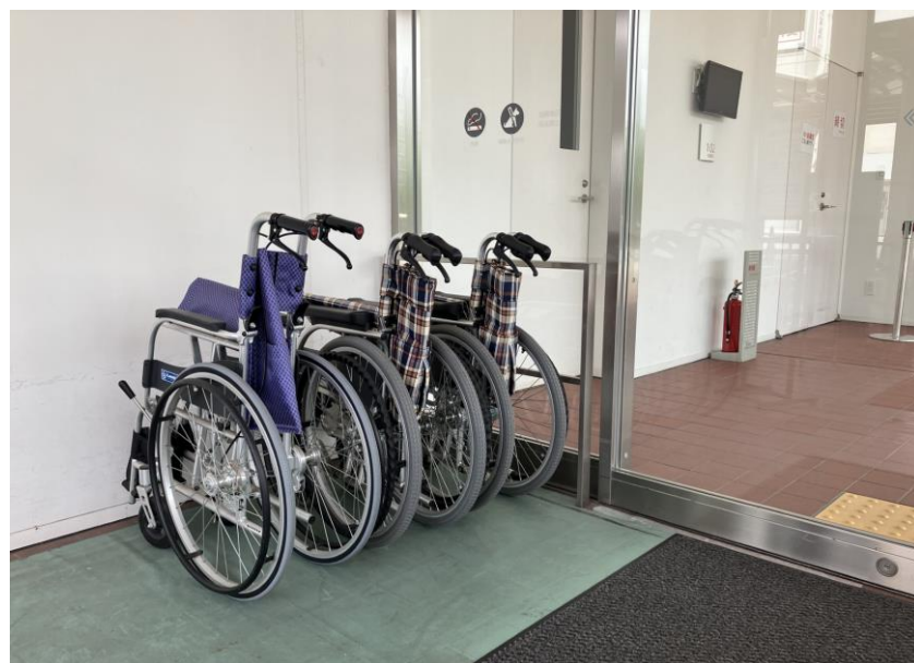
にしりりぐちかしだしようくるま 西入口貸出用車いす