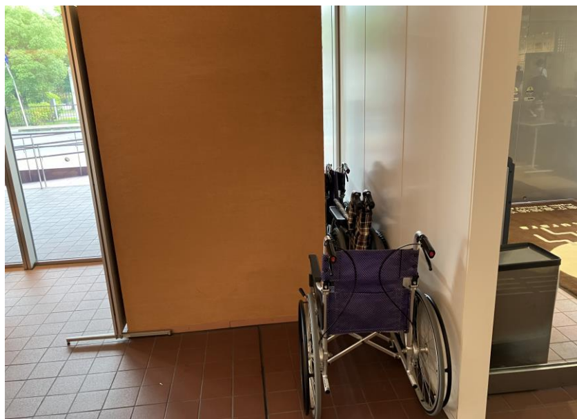
みなみいりぐちかしだしようくるま 南入口貸出用車いす